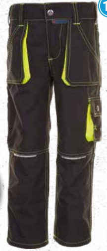
Bundhose Leib Wächter

in den Größen 86/92 bis 170/176 lieferbar