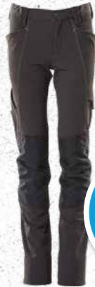
Hose für Kinder