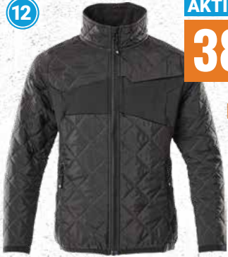
Kinderjacke mit Climascot- Futter