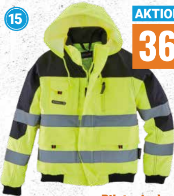
Pilotenjacke für Kinder