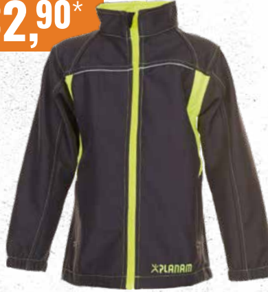
Junior Softshelljacke Planam